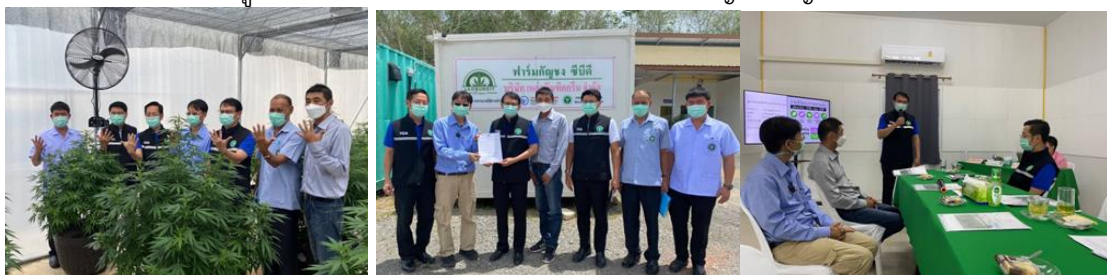
ฉลากผลิตภัณฑ์ “ ชากัญชง ”

กิจกรรมวันที่ ๒๓ พฤษภาคม ๒๕๖๕ เลขานุการสำนักงานคณะกรรมการอาหารและยาและคณะ ลงพื้นที่เยี่ยมชมกิจการผู้ประกอบการ บ.เหล่าบัณฑิตกรีน จำกัด พร้อมมอบใบอนุญาตสถานที่ ผลิตอาหารที่มีส่วนประกอบของกัญชา กัญชง เป็นรายแรกของจังหวัดสุราษฎร์ธานี และเป็นผู้ประกอบการ ที่เข้าร่วมโครงการพัฒนาผู้ประกอบการอาหารที่มีส่วนประกอบของกัญชา กัญชง ประจำปี ๒๕๖๕